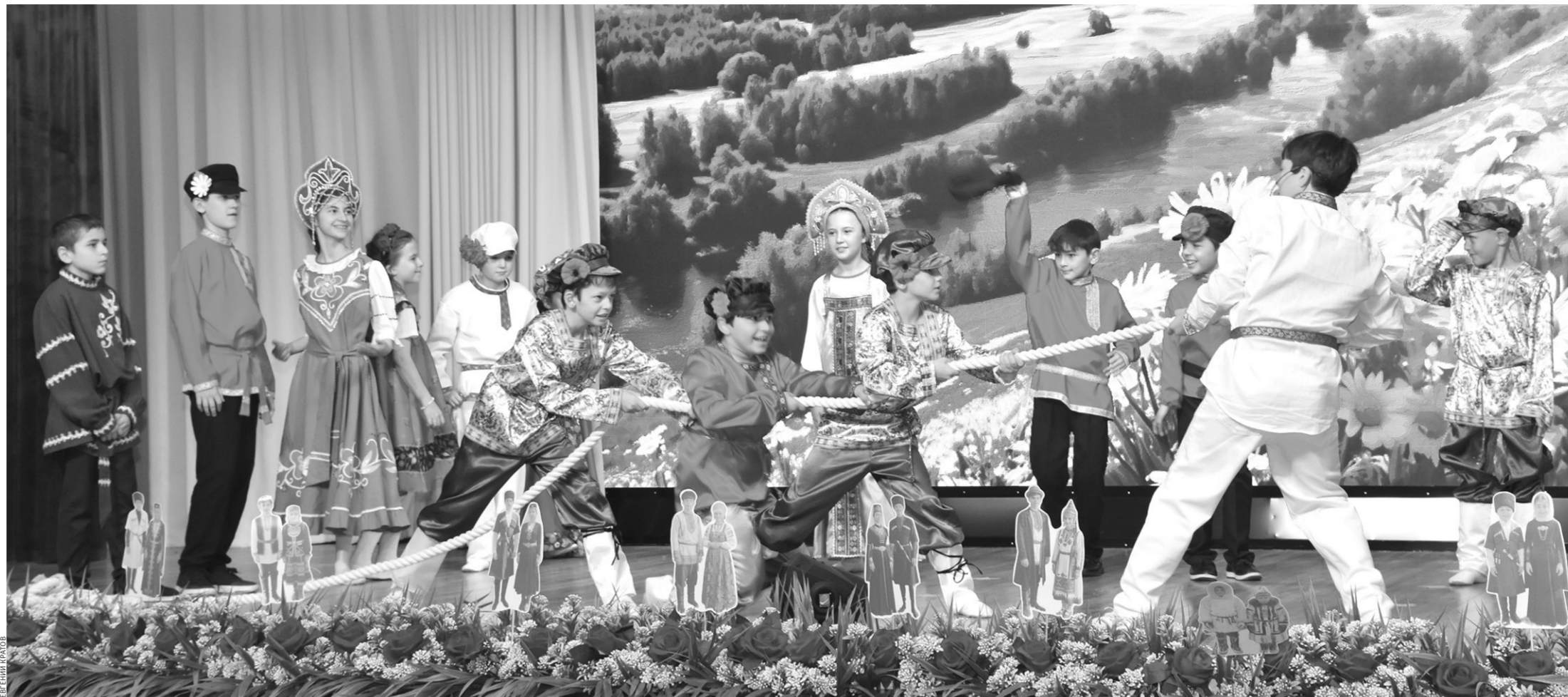
Юные артисты с большим вдохновением исполняли каждый номер программы

Далеко-далеко была одна дружная страна, где все жили спокойно и безмятежно. Но коварный Змей-искуситель вверг