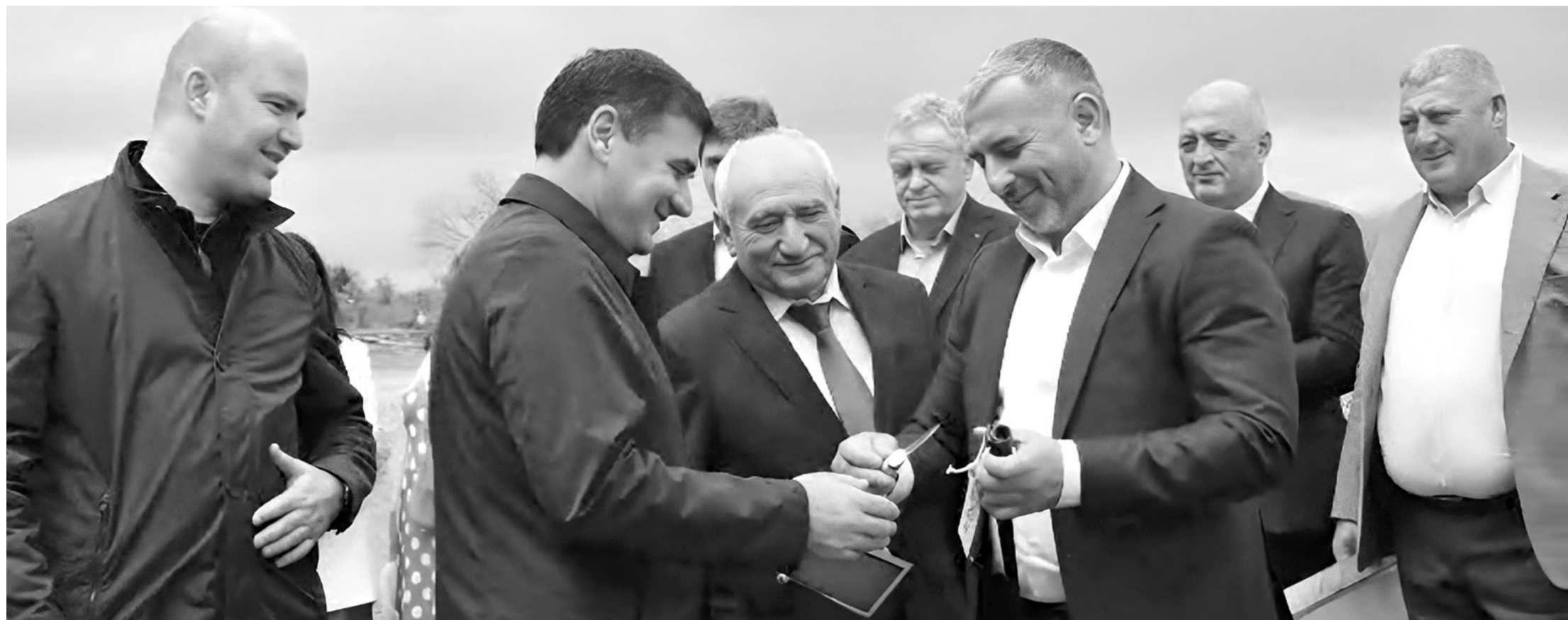
Делегация аула Псыж посетила абхазский аул Кутол

Абхазский Кутол и абазинский Псыж официально стали побратимами