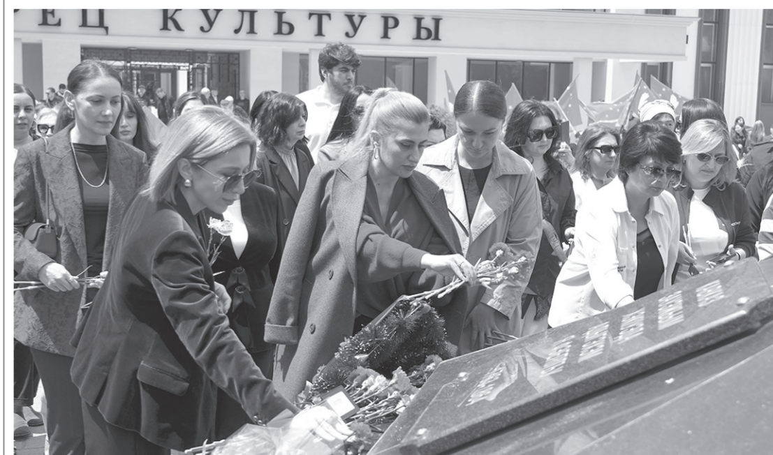
К памятнику жертвам Кавказской войны возложили цветы